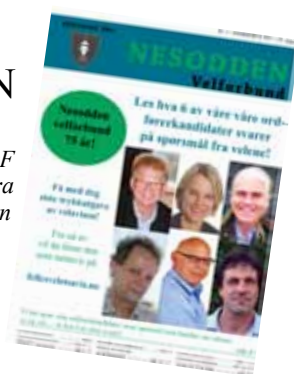
Foto: Bildene av representanten fra KrF og Høyre er hentet fra Amtas nettavis. Resten har vi fått tilsendt fra de forskjellige kandidatene.